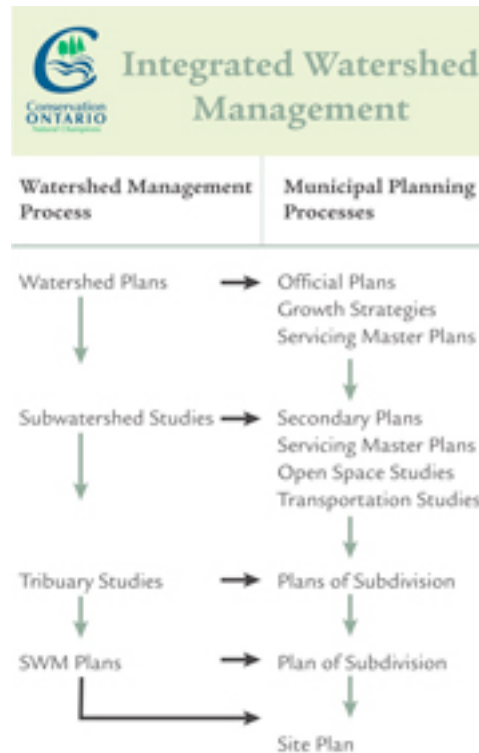
Figure 2 : Intégration des processus de la gestion des bassins versants et la planification municipale (Conservation Ontario, June 2010)

Intégration En Ontario, une évaluation environnementale individuelle n'est pas requise pour tous les projets. Dix types (classes) de projets sont identifiés, pour lesquels une approche rationalisée d'autoévaluation peut être utilisée par les municipalités. Une des classes est la « Municipal Class Environmental Assessment » qui s'applique aux projets des infrastructures municipales. Puisque différents types de projets ont différents niveaux d'impact sur l'environnement, quatre catégories de projet sont également identifiées, pour lesquelles différentes phases du processus d'évaluation sont nécessaires (tableau).